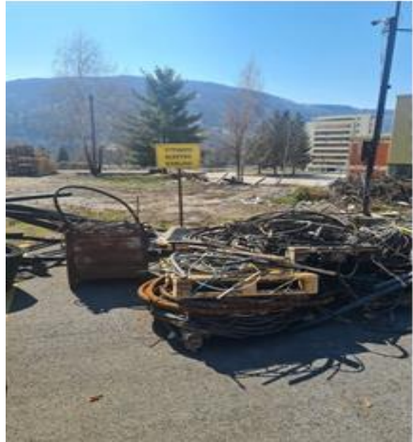
Otpadni Cu kablovi