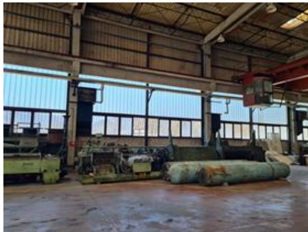
Otpadni čelik preko 6 mm