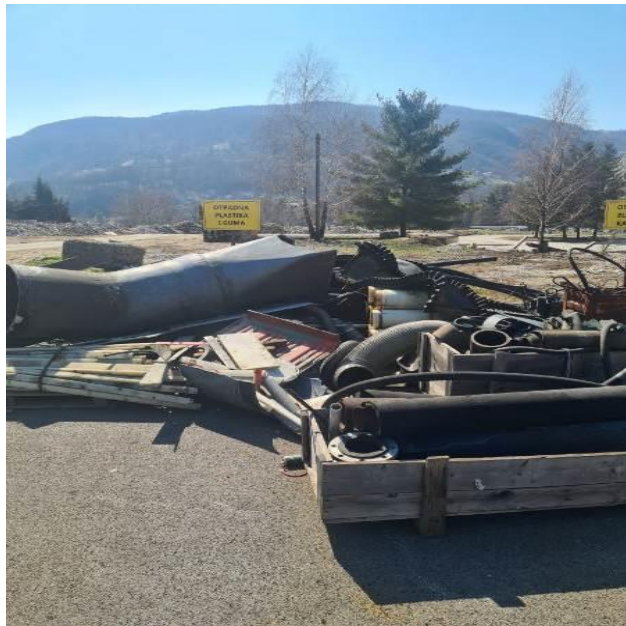
Otpadna plastika i guma