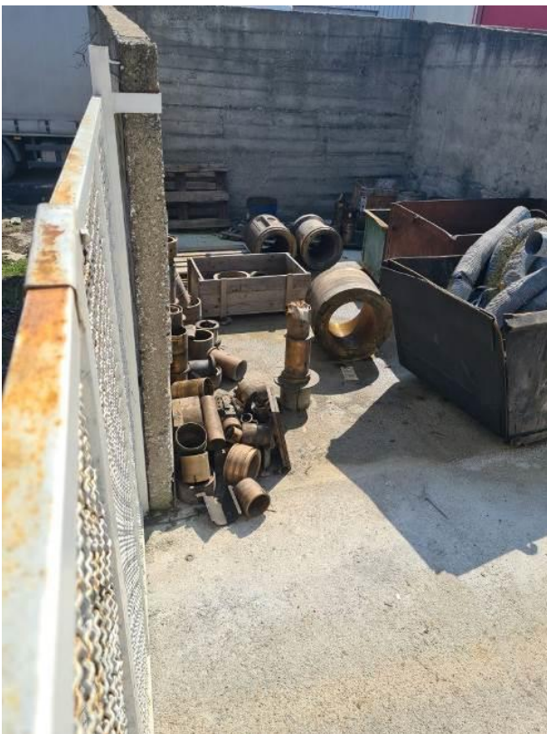
Otpadna bronza u komadima