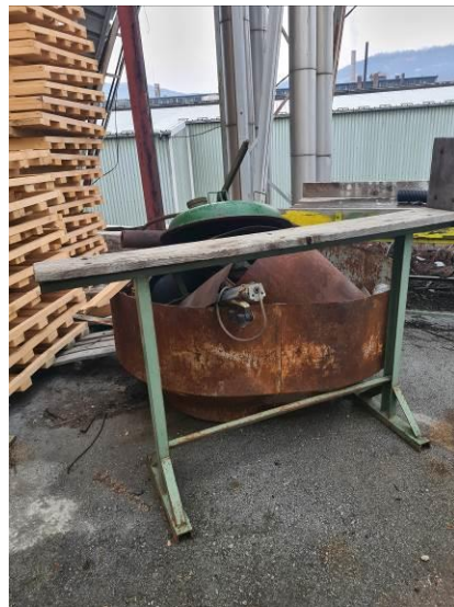
Otpadni čelik preko 3-6 mm