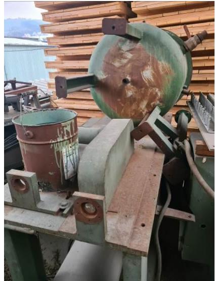
Otpadni čelik preko 6 mm